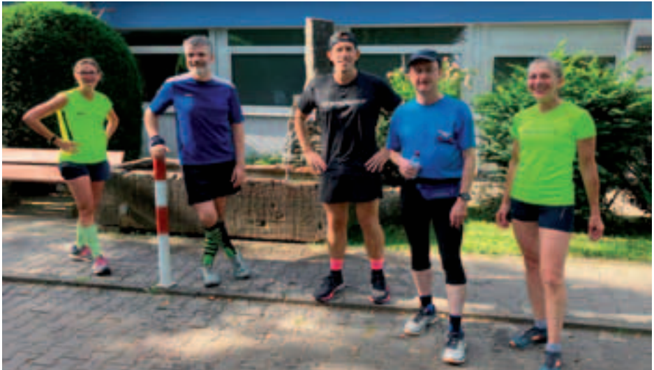
Aktive der TG-Naurod nach dem sonntags Lauftreff im September 2023

Das kultige Traditionslokal in Naurod. Treffpunkt für Jung und Alt. Mit bodenständiger Hausmannskost und Apfelwein aus eigener Kelterei.