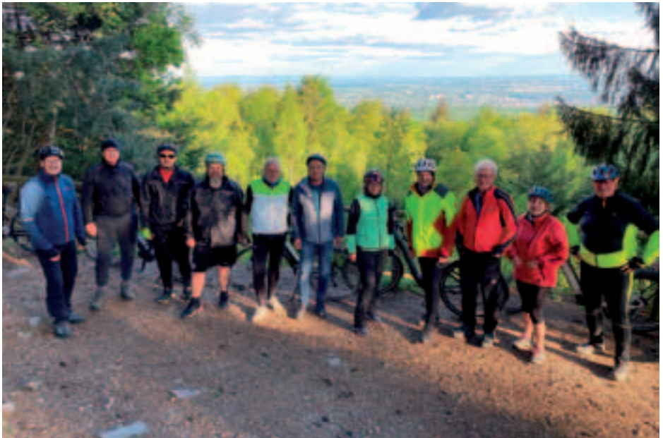
Auf der Platte