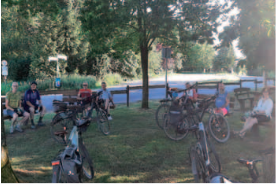
Rastplatz in Engenhahn