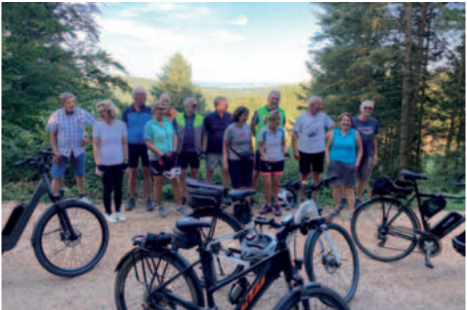
Vor der Skyline von Frankfurt