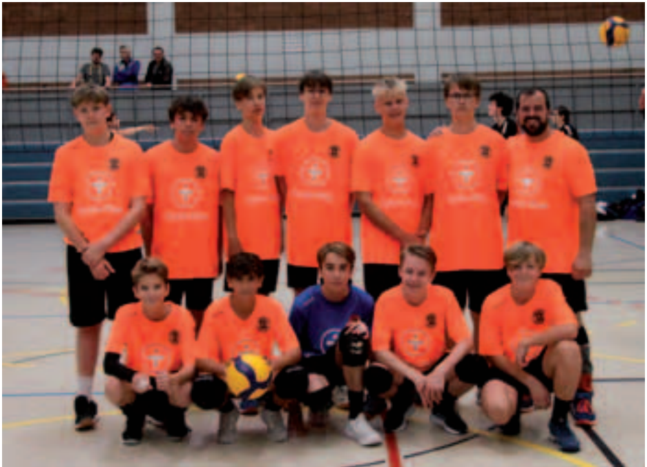
Herren 3/männliche Jugend

Überall wird zuversichtlich in die Zukunft geschaut und wir sind froh, in allen Altersklassen auf einen vollen Kader blicken zu können.