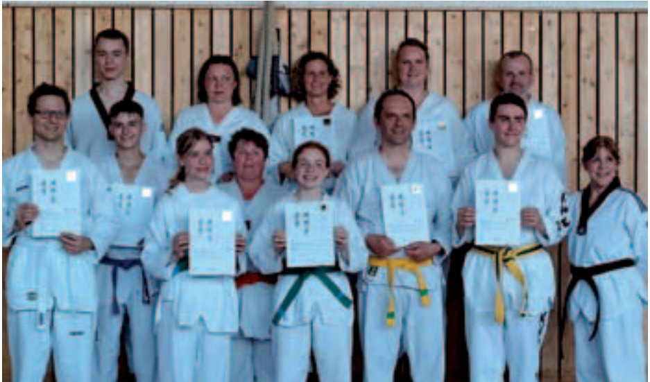
Prüfung erfolgreich bestanden!