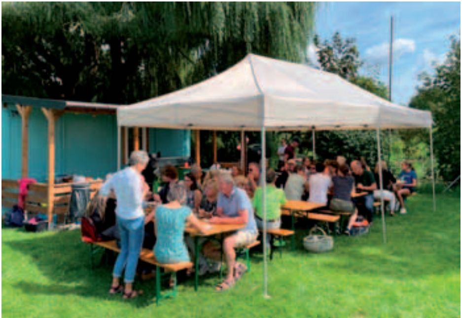
Sommerfest September 2023