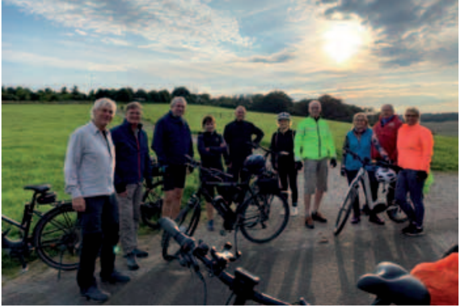
Auf dem Halberg in Wehen