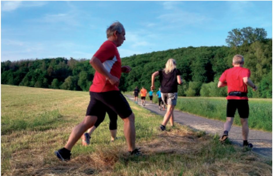
Lauftreff beim Training am Mittwochabend