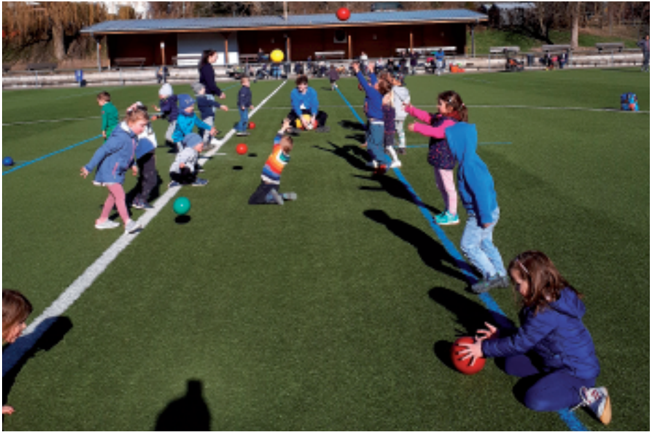
Ballspiele bei strahlend blauem Himmel