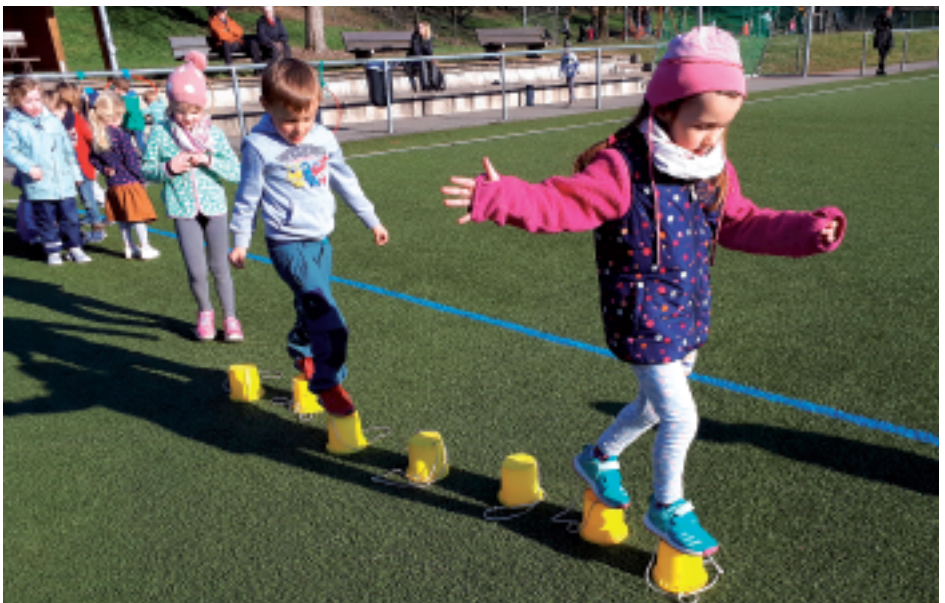
Konzentration und Gleichgewichtssinn war bei dieser Übung gefragt – und die Eltern schauten gespannt zu