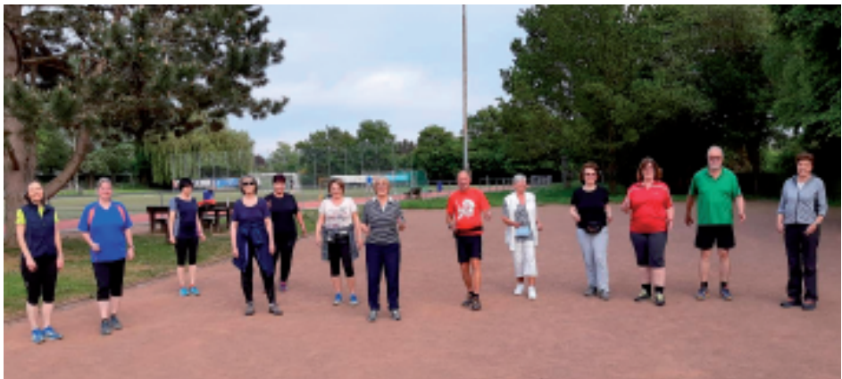
Die neue Walking Gruppe