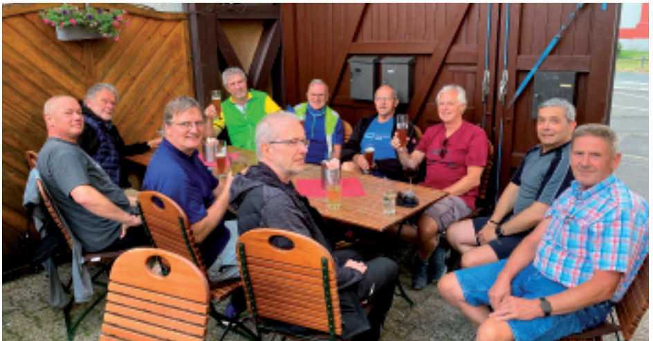
Erfolgreiche Tour zünftig beendet