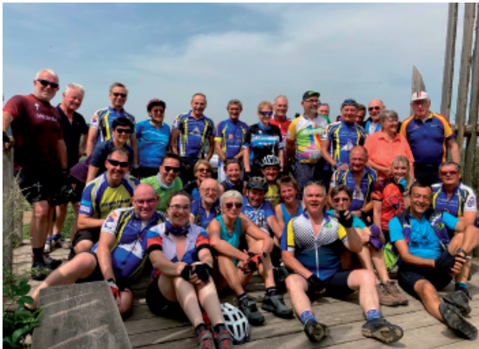
Geschafft auf dem Gipfel bei Saint-Lager am 22.05.2022

Geschafft, nach sechs Etappen sind wir glücklich in Fondettes angekommen. Wir wurden zeitnah von den Familien in Fondettes aufgenommen und am Samstagabend hatten unsere Fondetter Freunde noch einen gemütlichen Grillabend in Ihrem Vereinsheim organisiert.