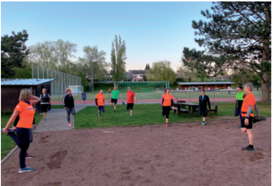
Lauftreff der TGN beim den Dehnübungen nach dem Lauf