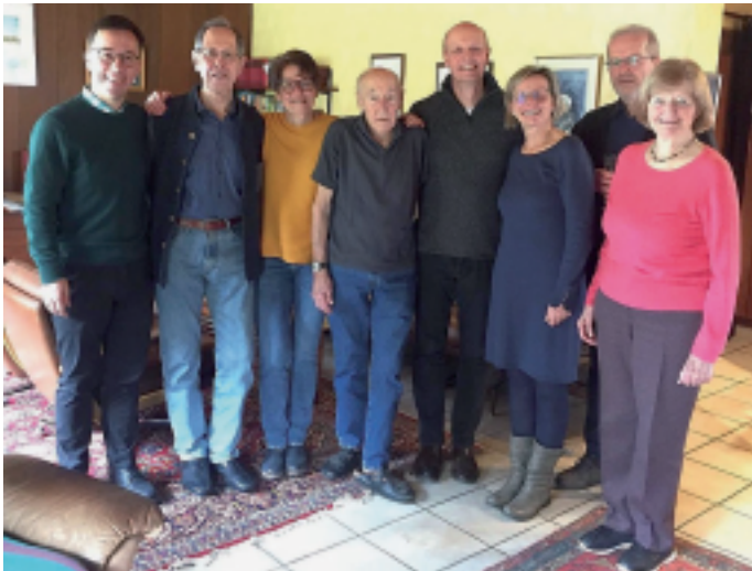
In Mitten der Gratulanten zu seinen 90. Geburtstag

Seine Wegbegleiter lobten die Zuverlässigkeit bei der Ausübung seiner Übungsleitertätigkeit. Schlechtes Wetter oder leichte Verletzungen waren kein Hinderungsgrund, zur Not wurden die Läufer mit dem Fahrrad begleitet.