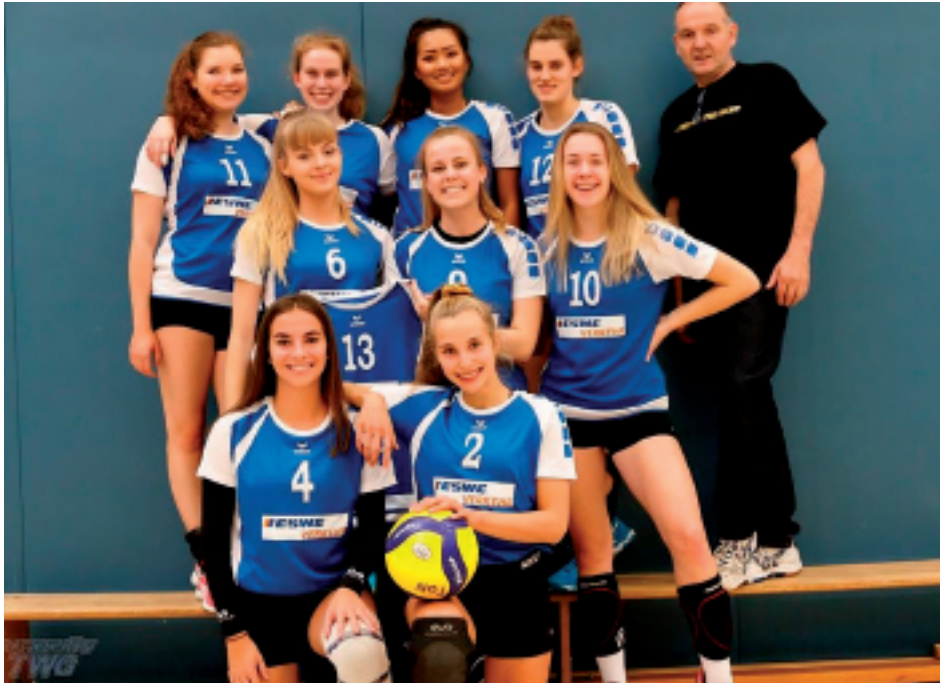
Gut geschlagen hat sich die 2. Damenmannschaft

In der immerhin bereits 3. Saison in der höchsten hessischen Spielklasse waren die Ambitionen der 1. Damenmannschaft vor Saisonbeginn sicher höher als das letztlich erzielte Ergebnis. Kurzfristige Abgänge und späte Zugänge sorgten für einen achterbahnartigen Beginn in die Saison. Früh zeichnete sich bereits ab, dass es am Ende drei Absteiger geben würde. Umso glücklicher war das gesamte Team, dass der vorzeitige Klassenerhalt mit vier Siegen in Folge und einem deutlichen Sieg gegen die SKV Mörfelden in der eigenen Halle gesichert werden konnte. Im Anschluss wurde der Klassenerhalt gefeiert, ehe sich herausstellte, dass dies am 29.2. auch das letzte Spiel und die letzte Zusammenkunft der Mannschaft für eine längere Zeit war.