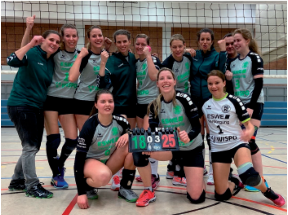
Sieg im letzten Spiel der Saison bedeutet Klassenerhalt für die D1