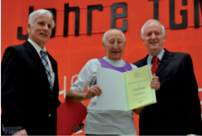
Ehrung anlässlich des 125-jährigen Vereinsjubiläums der TG Naurod

Seit 1997 war er nicht nur als Übungsleiter des Lauftreffs aktiv, sondern stand auch der TG Naurod als Sportwart zu Verfügung und koordinierte dabei rund 50 Übungsleiter.