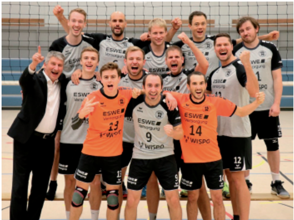
Beeindruckende Saison der H1, am Ende leider ohne Grund zum Jubeln

fahren werden. Die im letzten Bericht bemängelten Laufwege und das Abwehrverhalten konnten verbessert werden, auch konnten die Nauroder Herren in der Rückrunde (fast) alle engen Sätze für sich entscheiden - mit einer Ausnahme, einer 23:25 Satzniederlage bei dem späteren Bezirksliga-Meister TuS Kriftel 3. Mit dieser Leistungssteigerung konnte sich die Regionalligareserve auf den 7. Tabellenplatz in der Abschlusstabelle verbessern. Die neue Saison in der Bezirksliga steht leider nicht unter einem guten Stern: noch kurz vor Beginn haben einige Teams zurückgezogen, so dass nach dem positiven Saisonstart (mit zwei Siegen und einer Niederlage) gleich eine lange Pause ansteht.