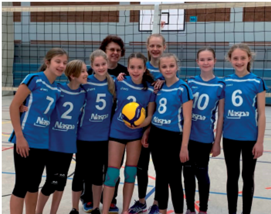
Die U14/U15 beim U15-Turnier daheim

Bis zum 13. März wurde auch Volleyball gespielt bei der TG Naurod. Die Saison 2019/20 wurde abrupt beendet und wird sicher in die Geschichtsbücher aller Vereine eingehen. Mit gemischten Gefühlen blicken die Volleyballerinnen und Volleyballer auf das letzte Jahr mit der abgebrochenen Saison und der langen Volleyballpause zurück. Und auch die aktuellen Entwicklungen deuten leider darauf hin, dass Vereinssport für eine ganze Weile nicht mehr so ausgeübt werden kann, wie es alle gewohnt waren.